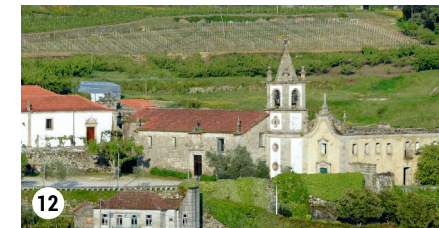
Monasterio de Santo André de Ancede. Monumento de la Ruta del Románico. GPS 41.101891 -8.056794