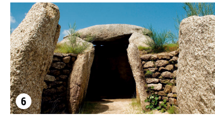
Dolmen de corredor de Chã de Parada I. Monumento nacional. Integra el conjunto megalítico de la serra da Aboboreira. GPS 41.202882 -8.007727