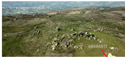
Serra da Aboboreira