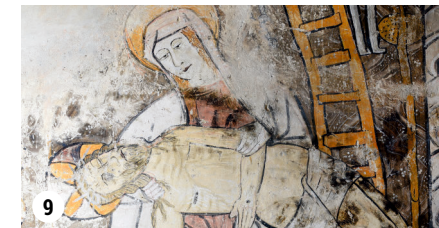
Detalle de pintura mural de la iglesia de Santiago de Valadares. Monumento de la Ruta del Románico. GPS 41.144538 -7.982819