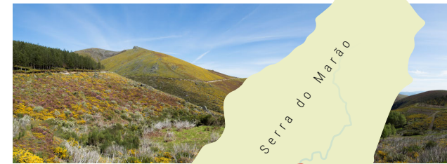
Serra do Marão