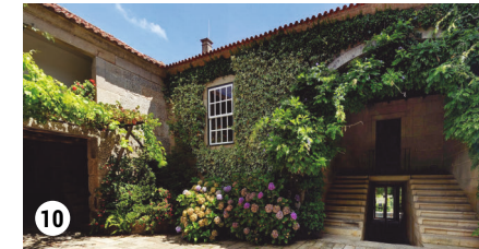
Fundação Eça de Queiroz – Núcleo museológico. Quinta de Vila Nova – Tormes. GPS 41.124972 -8.004266