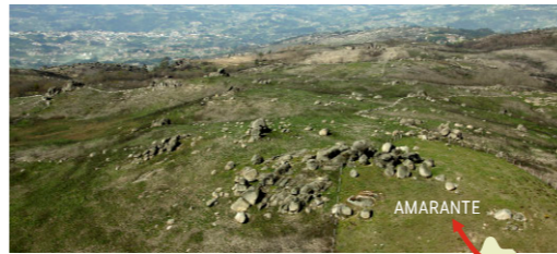
Serra da Aboboreira