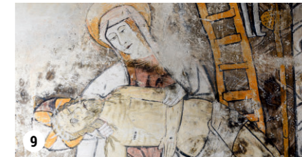
Mosteiro de Sto. André de Ancede. Monumento da Rota do Românico. GPS 41.101891 -8.056794