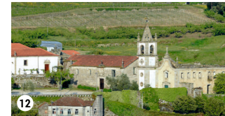
Fundação Eça de Queiroz – Núcleo museológico. Quinta de Vila Nova – Tormes. GPS 41.124972 -8.004266